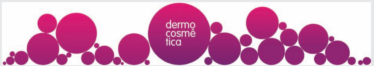
Desarrollo de la comunicación superior para una categoría de dermocosmética

Una de las líneas más potentes en comunicación. Los colores marcan las secciones consiguiendo una integración fluida y perfecta en la zona de exposición, dando como resultado una unidad visual espectacular. Los círculos como figuras contundentes son claros a la hora de transmitir la categoría mediante el texto y por el color identificativo de cada categoría.