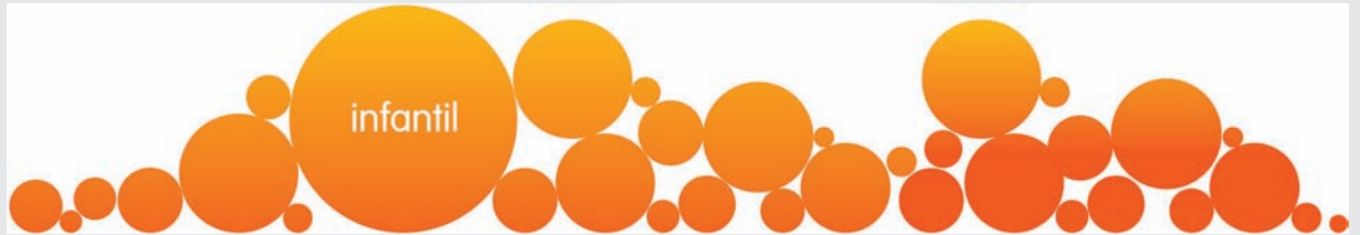
Desarrollo de la comunicación superior para una categoría de infantil